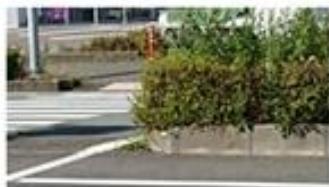
視角を遮る植樹帯 小松島中学校近くの国道55号線

通学路を含め、歩行者・自転車交通の安全対策を 近藤 学校周辺、特に国道55号の樹木帯未整備の死角解消、安全性に向け、歩行者・自転車環境の整備を求